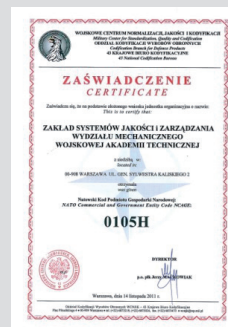
Natowski Kod Podmiotu Gospodarki Narodowej (NCEG)